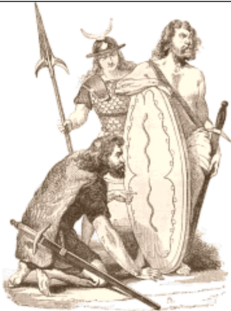
Guerriers gaulois (1 er siècle avant JC)

Les Gaulois battent les Romains à Gergovie (-52). Les troupes de César refluent vers le sud, vers la Provincia romaine (la Provence). Les Gaulois poursuivent les Romains mais sont battus. Ils se replient vers Alésia.